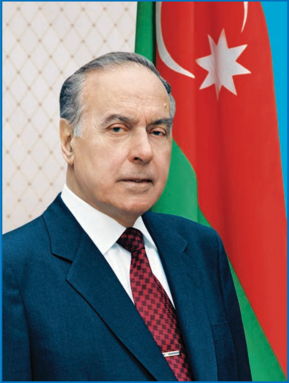
HEYDƏR ƏLİYEV AZƏRBAYCAN XALQININ ÜMUMMİLLİ LİDERİ