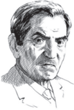
MƏHƏMMƏDHÜSEYN ŞƏHRİYAR (1905 – 1988)

• Onun yaradıcılığı təkcə ona görə qiymətli deyildir ki, xalq ruhu ilə yoğrulub, həm də ona görə dəyərlidir ki, otaylı-butaylı ədəbiyyatımızın arasında yeni və heç vaxt zəifləməyəcək körpü salıb.