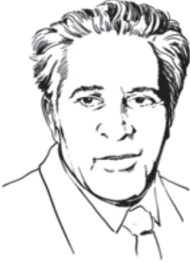
MƏMMƏD ARAZ (1933 – 2004)

• O, milli Azərbaycan şeirinin görkəmli nümayəndəsidir. İndiki səviyyədə Məmməd Arazın şeirləri və poemaları, bədii publisistikası yalnız öz yaradıcısının deyil, mənsub olduğu xalqın da tərcümeyihəsinin əsas hissəsidir.