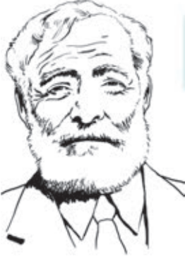
ERNEST HEMİNGVEY (1899 – 1961)

• “Yazıcının vəzifəsi dəyişməzdir. O özü dəyişir, amma onun vəzifəsi olduğu kimi qalır. Bu da ondan ibarətdir ki, həmişə həqiqəti yazasan, həqiqətin nədən ibarət olduğunu başa düşsən, onu elə ifadə edəsən ki, bu həqiqət oxucunun şüuruna onun öz təcrübəsinin bir parçası kimi daxil olsun”.