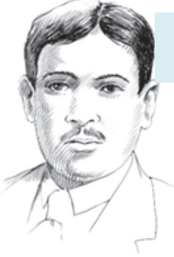
ƏHMƏD CAVAD (1892 – 1937)

• O, Azərbaycan poeziyasının özünəməxsus ədəbi taleyi, sənətdə orijinal yolu olan nadir simalarından biridir. Ə.Cavad ümumşərq islam zehniyyətinə, ümumtürk mənəvi qaynaqlarına, xüsusən də erkən orta əsrlərdən üzü bəri davam edib gələn anadilli şeirimizə dərinləndən bələd idi. Bəkir Nəbiyev