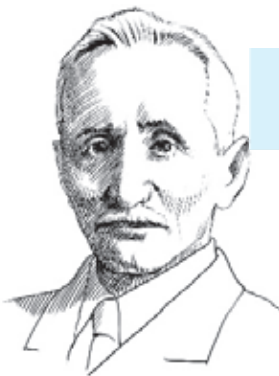
ABDULLA ŞAIQ (1881 – 1959)

• Yiğcam süjet, doğru və dəqiq bədii təsvirlər, hadisənin təbii inkişafı, mənalı dialoq və lirik əhvali-ruhiyyə onun hekayələrinin gözəl xüsusiyyətləridir.